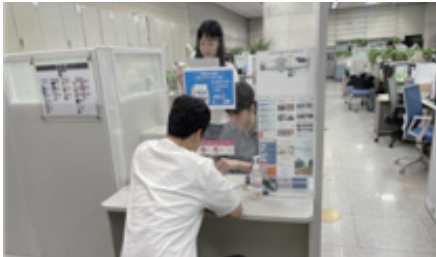
민원인 방문 상담과 동시에 신청서류 작성 및 신속한 처리로 민원 만족도 상승